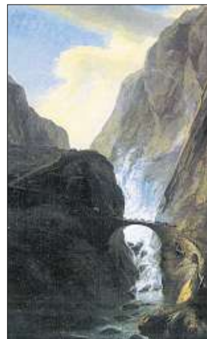
L'emprima Punt dal Diavel.

Sper quest schlargiament da las vias da traffic tras la Val Scalina ha cumenzà vers la fin dal 19avel tschientaner in ulteriur chapitel, numnadamain l'intenziun da sviar la Val Scalina ed il Gottard «tras il grip». L'onn 1881 è vegnì avert il tunnel da viafier dal Gottard che maina sur ina lunghezza da 15 kilometers da Gösche-